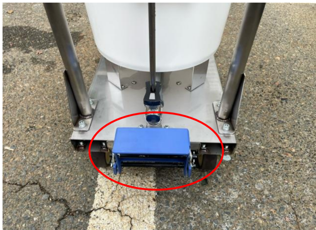
3.フットペダルでブラシを降ろします