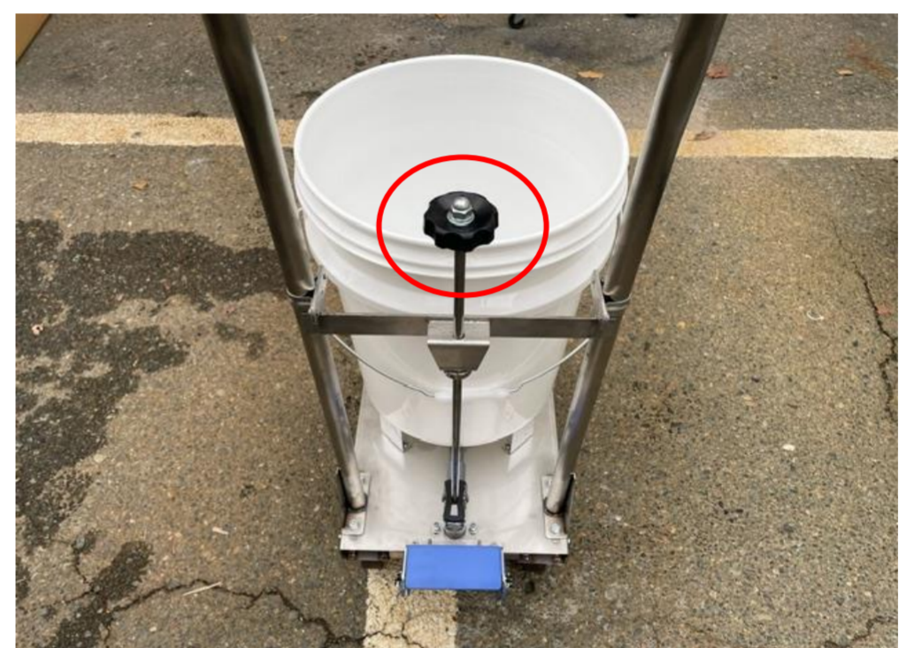
4.コックを開くと洗剤が塗布できます。

※使用中にビスやネジなどが緩む場合がございます。 ドライバーや、六角レンチで締めてください。